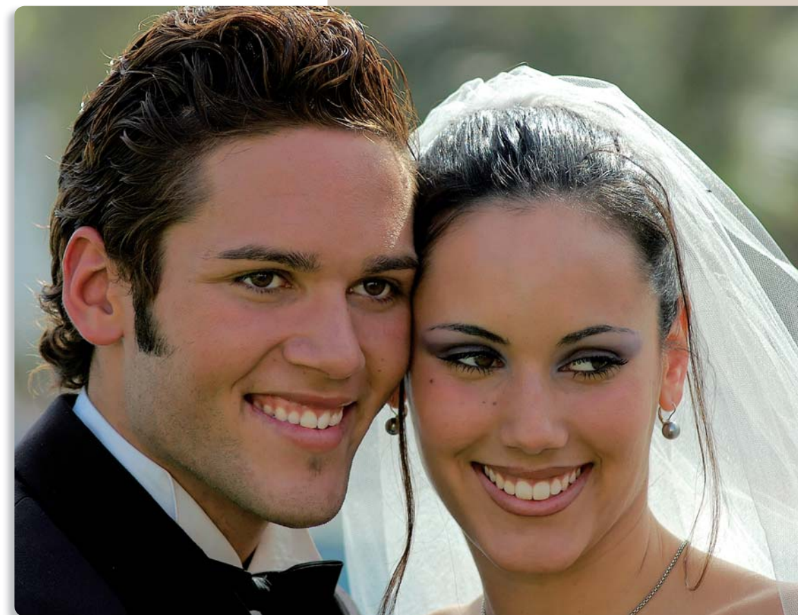
▲ STIMMUNGSVOLL: Bei diesem Foto sieht man dem Brautpaar die Freude an. Die beiden sehen leicht an der Kamera vorbei – das Bild bekommt dadurch einen verträumten Touch.

Auch kleine Diffusoren sorgen für eine weiche Ausleuchtung. Sie kosten rund 40 Euro und lassen sich mit einem Klett-Band am Blitz befestigen (erhältlich zum Beispiel bei www.fotobrenner.de ).