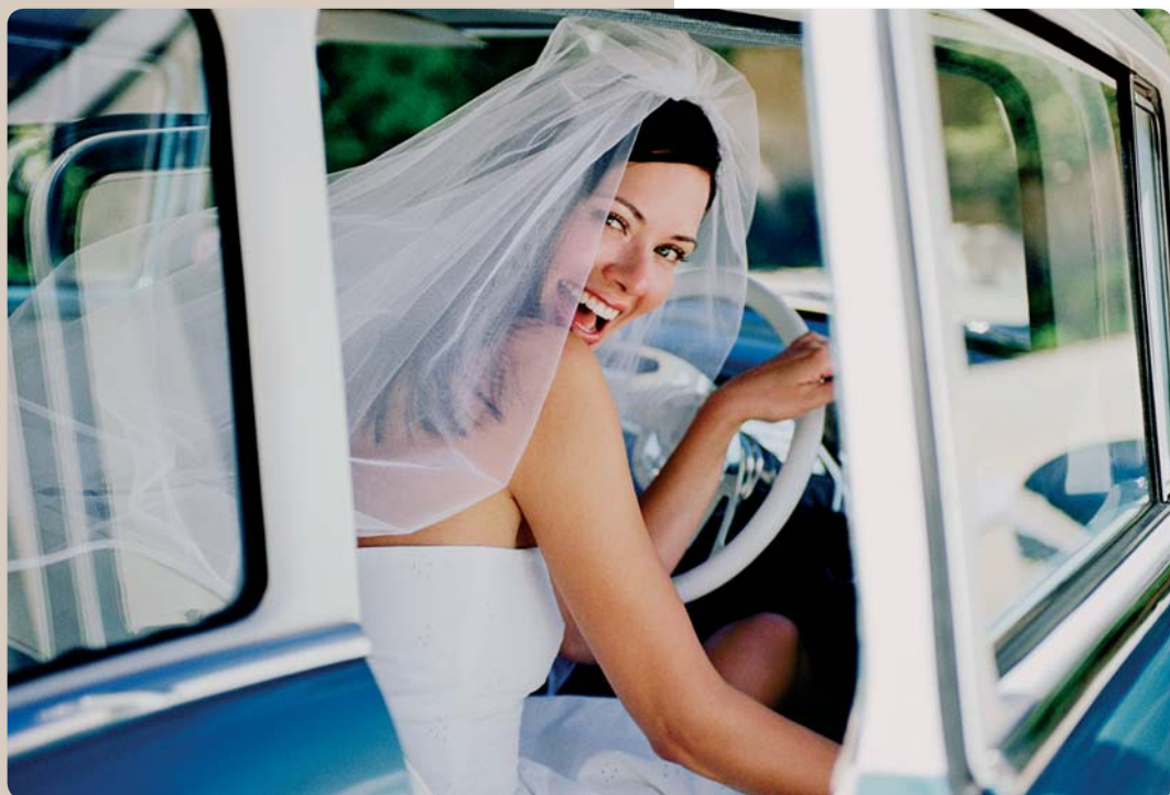
▼ LOCKER: Ein schönes Hochzeitsauto sollte unbedingt in den Bilderreigen mit einbezogen werden.