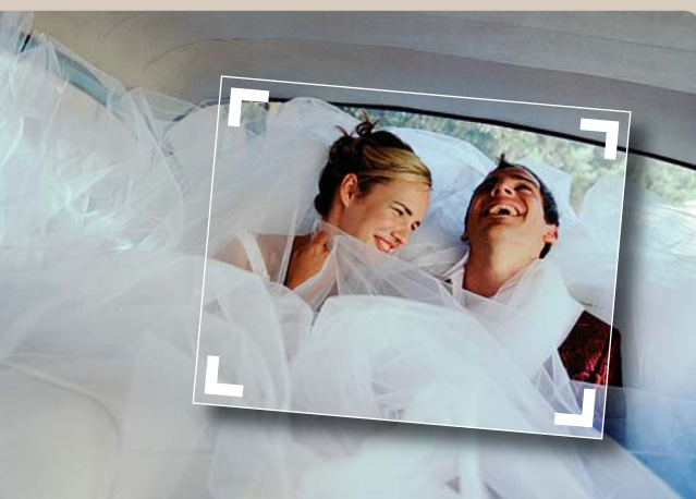
▲ AUSGELASSEN: Das Brautkleid füllt beinahe das ganze Auto aus. Bei solchen Aktionen kommt der Spaß am Posieren von selbst.