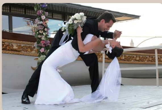
▲ INSZENIERT: Auch gestellte Situationen können locker aussehen. Das Brautpaar hat bei dieser Pose sichtlich viel Spaß.